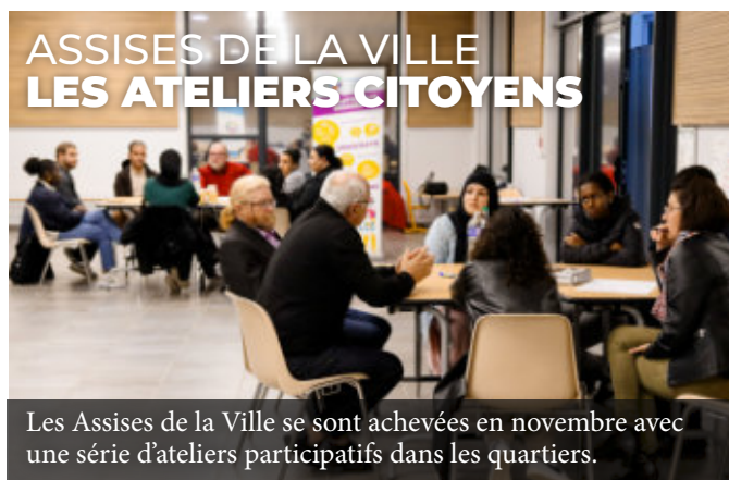
ASSISES DE LA VILLE LES ATELIERS CITOYENS