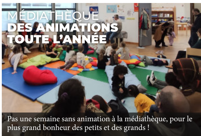
MÉDIATHÈQUE DES ANIMATIONS TOUTE L'ANNÉE