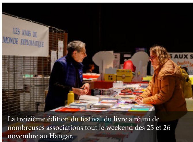
La treizième édition du festival du livre a réuni de nombreuses associations tout le weekend des 25 et 26 novembre au Hangar.