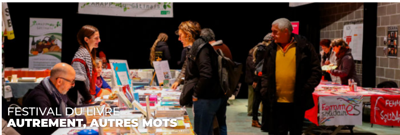
FESTIVAL DU LIVRE AUTREMENT, AUTRES MOTS