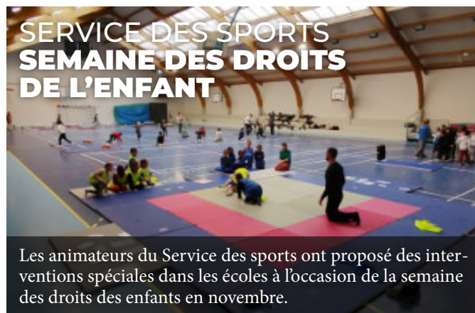
SERVICE DES SPORTS SEMAINE DES DROITS DE L'ENFANT