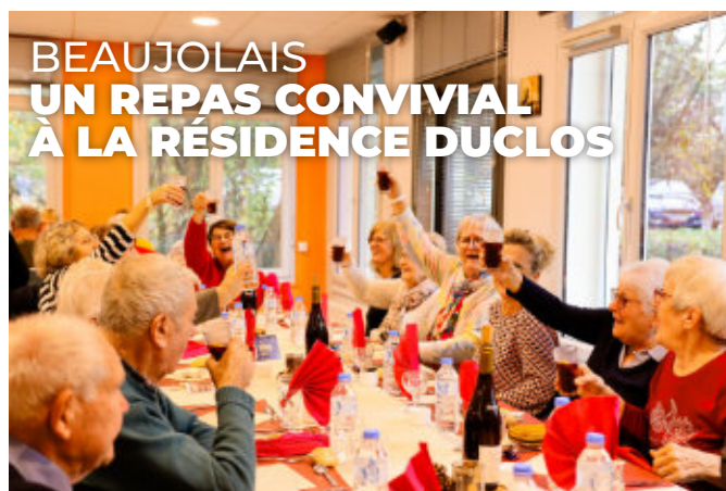
BEAUJOLAIS UN REPAS CONVIVAL À LA RÉSIDENCE DUCLOS