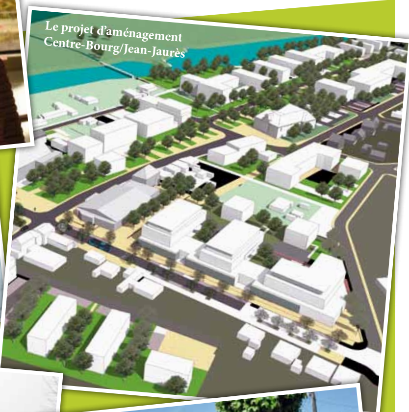
Le projet d'aménagement Centre-Bourg/Jean-Jaurès