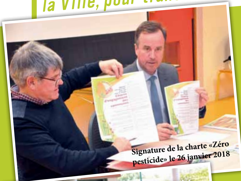
Signature de la charte «Zéro pesticide» le 26 janvier 2018