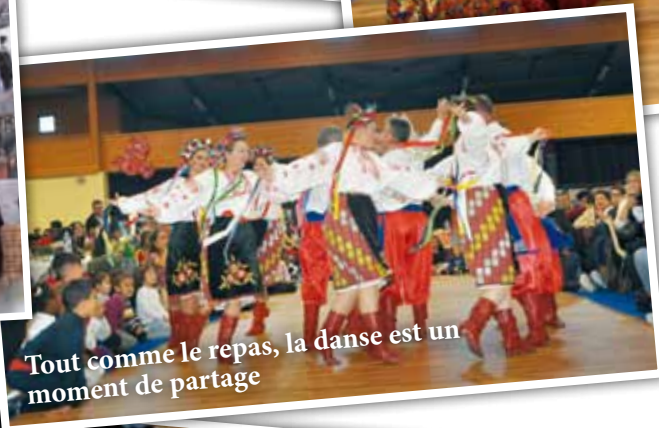
Tout comme le repas, la danse est un moment de partage