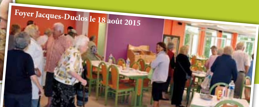
Foyer Jacques-Duclos le 18 août 2015