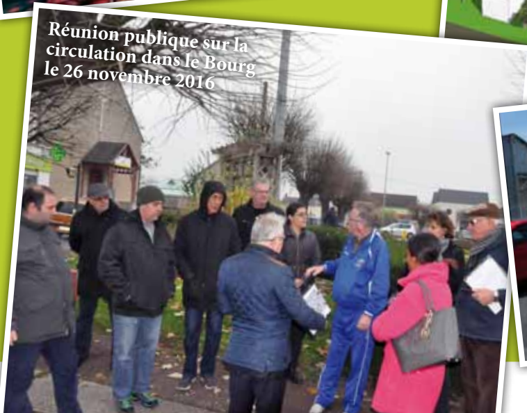
Réunion publique sur la circulation dans le Bourg le 26 novembre 2016