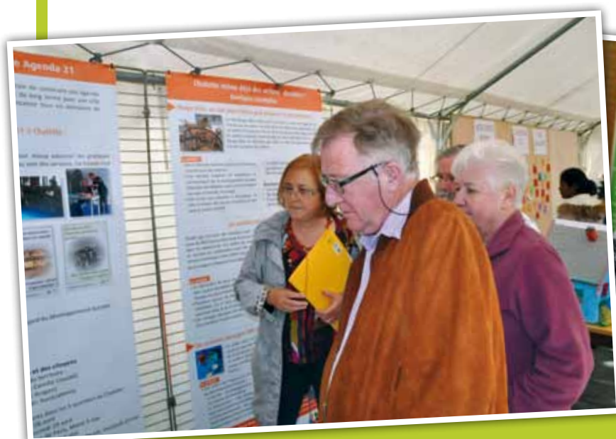
Élaboration de l'Agenda 21 avec les habitants Ici, rue Victor-Hugo le 26 avril 2015