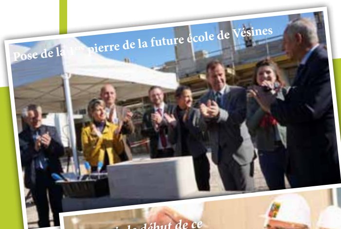
Pose de la pierre de la future école de Vésines

Concernant le fleurissement de la ville et pour respecter les nouvelles dispositions en matière d'environnement, le service analyse et étudie les espaces afin de diminuer le fleurissement en tentant de conserver la 3ème fleur, d'autant que les conditions d'attribution des fleurs ont