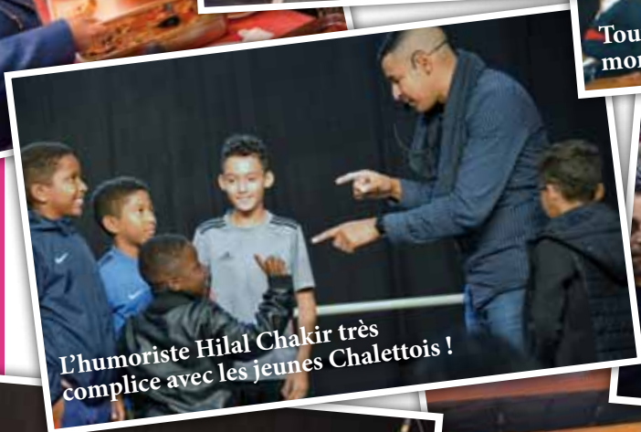
L'humoriste Hilal Chakir très complice avec les jeunes Chalettois !