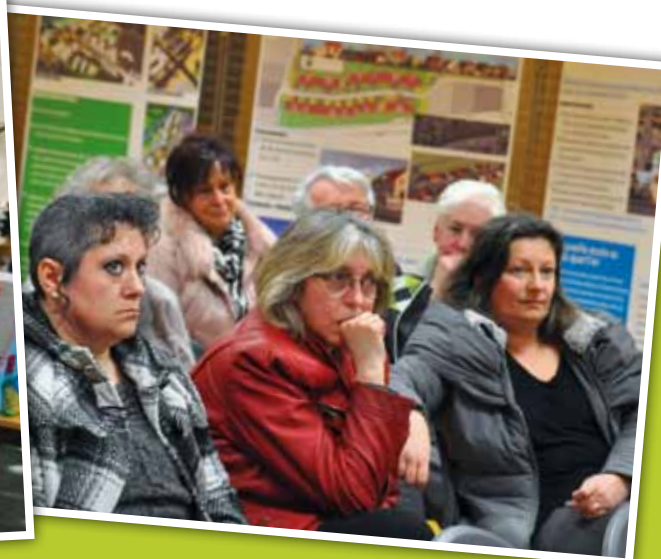
Réunion sur l'étude urbaine du Bourg le 9 mars 2016