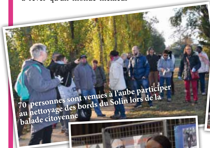
70 personnes sont venues à l'aube participer au nettoyage des bords du Solin lors de la balade citoyenne