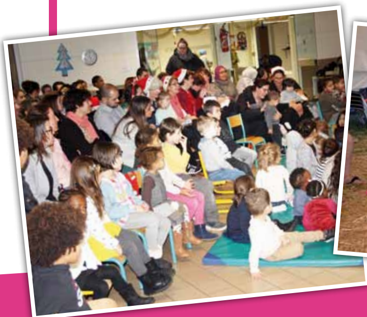
Noël du RAM 2017

• Garde à domicile (baby-sitting) : face à l'augmentation des horaires atypiques, au besoin de bénéficier d'heures pour chercher du travail, mais aussi pour pouvoir s'octroyer du temps, le RAM travaille à la mise en place d'un dispositif de garde à domicile, les assistantes maternelles ne répondant pas à ces besoins ponctuels. Une réflexion est en cours avec le Point Information Jeunesse afin de créer un listing de personnes susceptibles de répondre à la demande, lesquelles suivraient préalablement une formation de deux ou trois jours (brevet premiers secours, approche de la petite enfance, hygiène...).