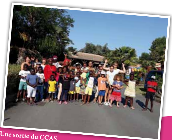
Une sortie du CCAS

Parmi ses missions, le Centre communal d'action sociale apporte aide et soutien aux familles en difficulté. Ainsi chaque été, il permet à des familles de s'organiser pour partir une semaine en village vacances et propose une journée à la mer. Il apporte son soutien pour la constitution des dossiers pour l'ouverture des droits, il participe aux forums d'accès aux droits, travaille avec la Banque alimentaire, à laquelle la ville Verse une subvention de 25 000 €, et la Ruche éco.