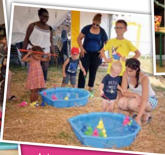
Animation du RAM à (F)halette Festival 2018